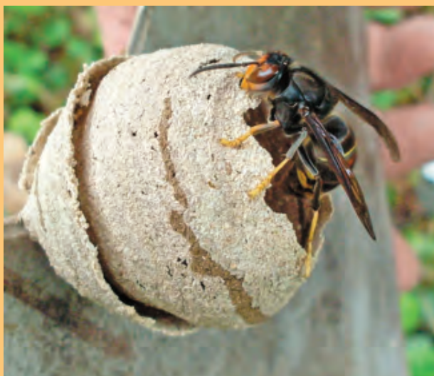
Frelon asiatique sur nid primaire