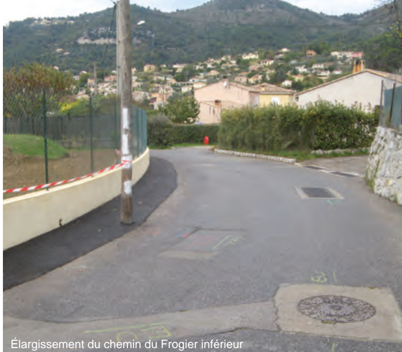
Élargissement du chemin du Frogier inférieur