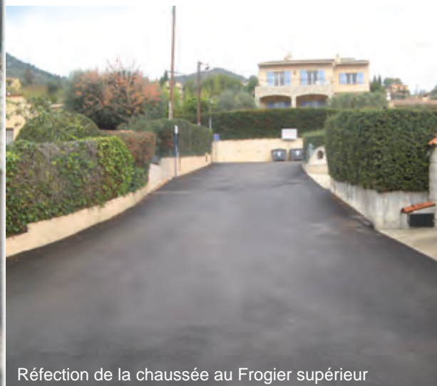
Réfection de la chaussée au Frogier supérieur