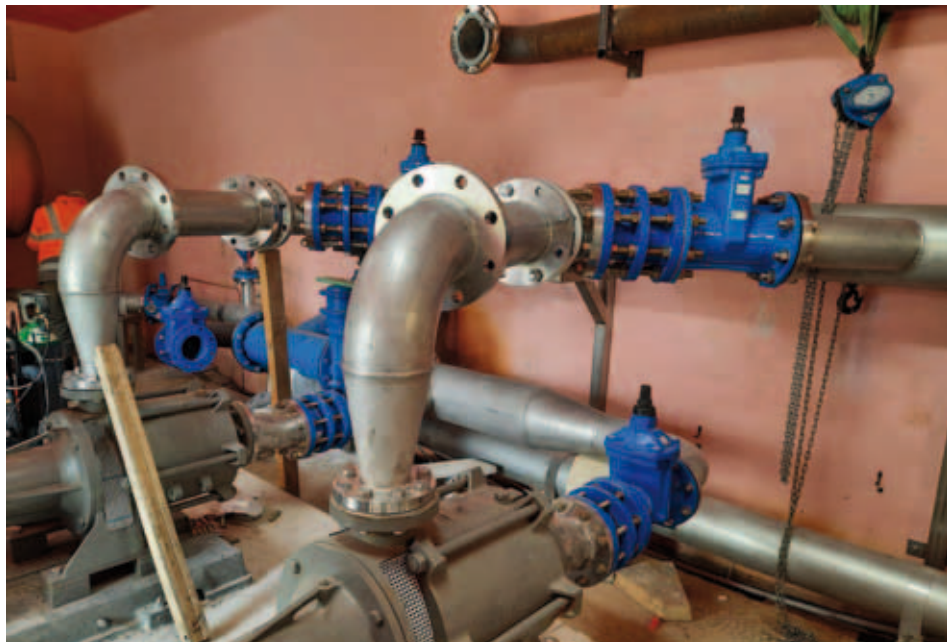
Réhabilitation de la station de pompage de la Rohière

Tous ces travaux ont un intérêt à la fois économique et environnemental, car ils visent à réduire les pertes d'eau dues notamment aux fuites. Actuellement, il y a une déperdition d'environ 30 % sur l'eau que l'on fait transiter. ■